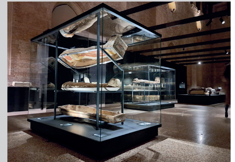
Mostra "I Creatori dell'Egitto eterno" - Basilica Palladiana, Vicenza

collaborazione con l'Archivio Storico Ricordi e l'opera video "Seven Deaths" dell'artista serba. Le ultime realizzazioni temporanee, ancora visitabili, le possiamo trovare a Perugia con la mostra "L'enigma del Maestro di San Francesco. Lo stil novo del Duecento Umbro" e la mostra "Novecento" presso il Meis - Museo Nazionale dell'Ebraismo italiano e della Shoah a Ferrara.