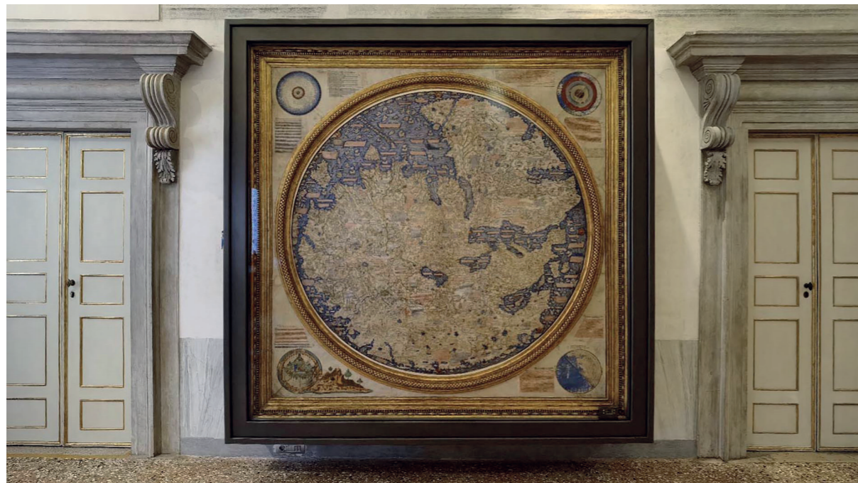
Espositore Mappamondo Fra' Mauro - Biblioteca Nazionale Marciana, Venezia